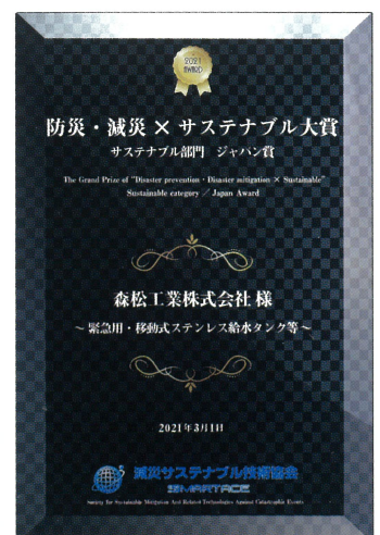
「サステナブル部門 ジャパン賞」